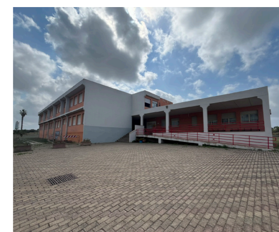
A16 - I.C. 1 "Karol Wojtyła"