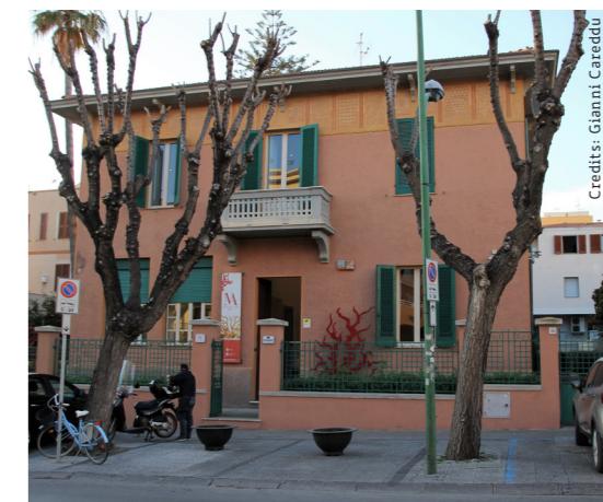
A15 - MACOR Museo del Corallo