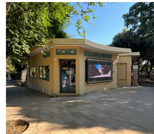
A11 - Ufficio Turistico e Protocollo