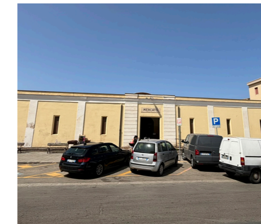
A12 - Mercato Civico