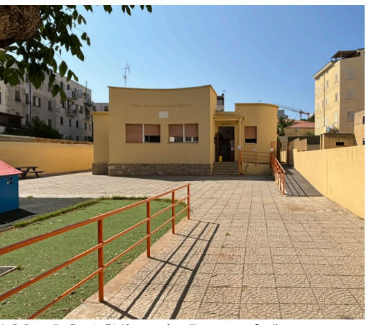
A09 - I.C. 1 "Vittorio Emanuele"