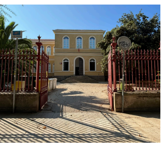
A08 - I.C. 1 "Sacro Cuore"