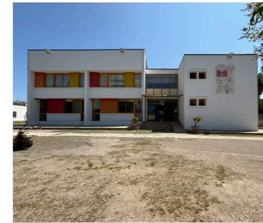
A02 - I.C. 2 "La Pedrera"