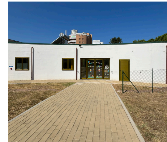
A04 - Micronido comunale