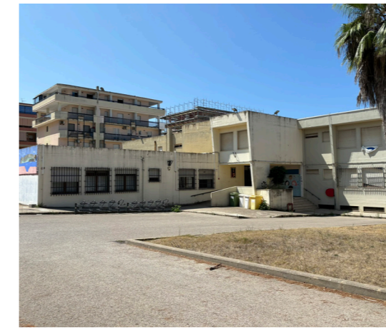
A03 - I.C. 2 "Maria Carta"