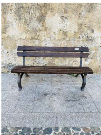
TIPO B2 PANCA IN DOGHE DI LEGNO E STRUTTURA IN GHISA