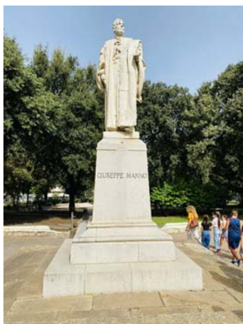
GIARDINI GIUSEPPE MANNO