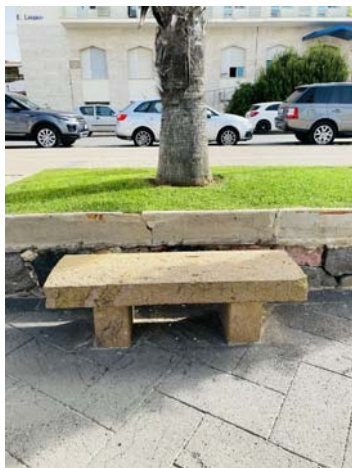
TIPO C2 PANCA IN PIETRA NATURALE DI TRACHITE ROSSA