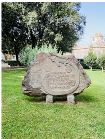
GIARDINI LA LEPANTO-CECCHINI