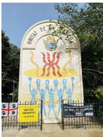
VIA VITTORIO EMANUELE II