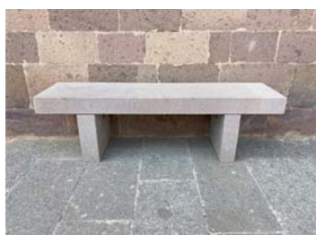
TIPO C4 PANCA IN PIETRA NATURALE DI TRACHITE ROSSA A TAGLIO MODERNO