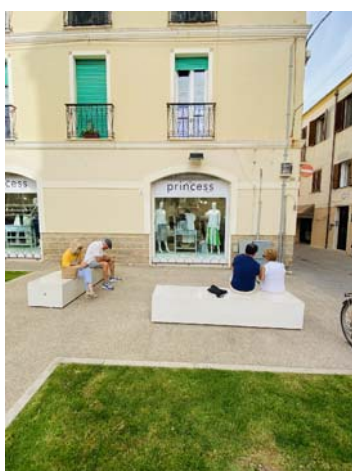
TIPO D PANCA MONOLITICA IN CONGLOMERATO CEMENTIZIO