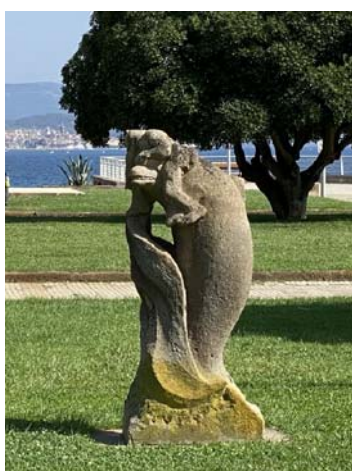
PIAZZA SAN MARCO