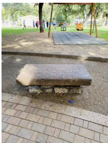
TIPO C3 PANCA IN PIETRA NATURALE DI TRACHITE ROSSA E BASAMENTO IN MURATURA