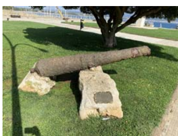
PIAZZA SAN MARCO