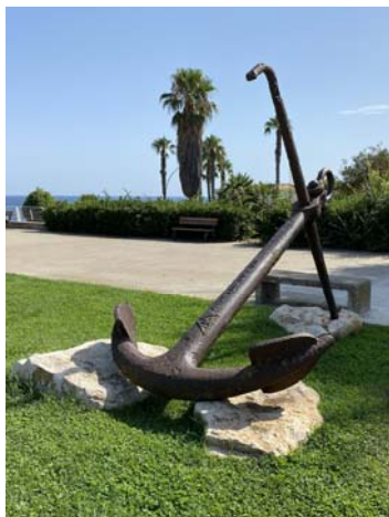
PIAZZA SAN MARCO