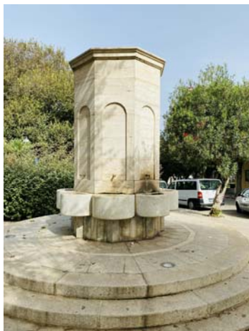
VIA VITTORIO EMANUELE II