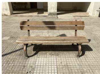
TIPO B2 PANCA IN DOGHE DI LEGNO E STRUTTURA IN GHISA