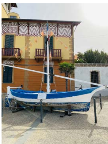
VIA GIUSEPPE GARIBALDI