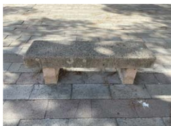
TIPO C2 PANCA IN PIETRA NATURALE DI TRACHITE ROSSA