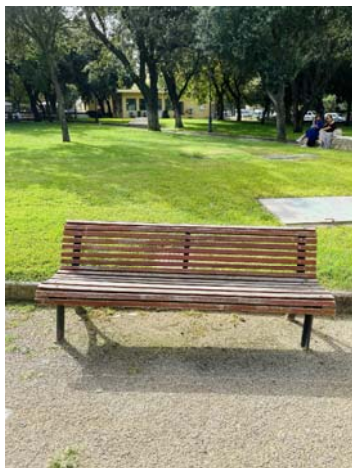
TIPO B PANCA IN DOGHE DI LEGNO E STRUTTURA IN GHISA