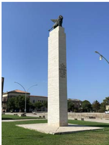
PIAZZA SAN MARCO