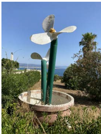
PIAZZA SAN MARCO