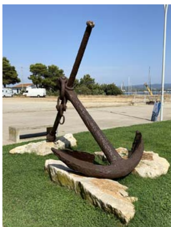
PIAZZA SAN MARCO