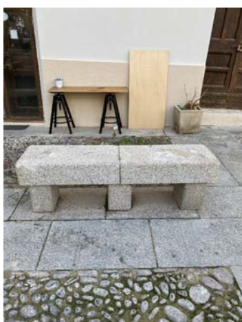
TIPO C PANCA IN PIETRA NATURALE DI GRANITO