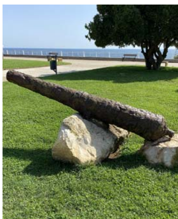
PIAZZA SAN MARCO