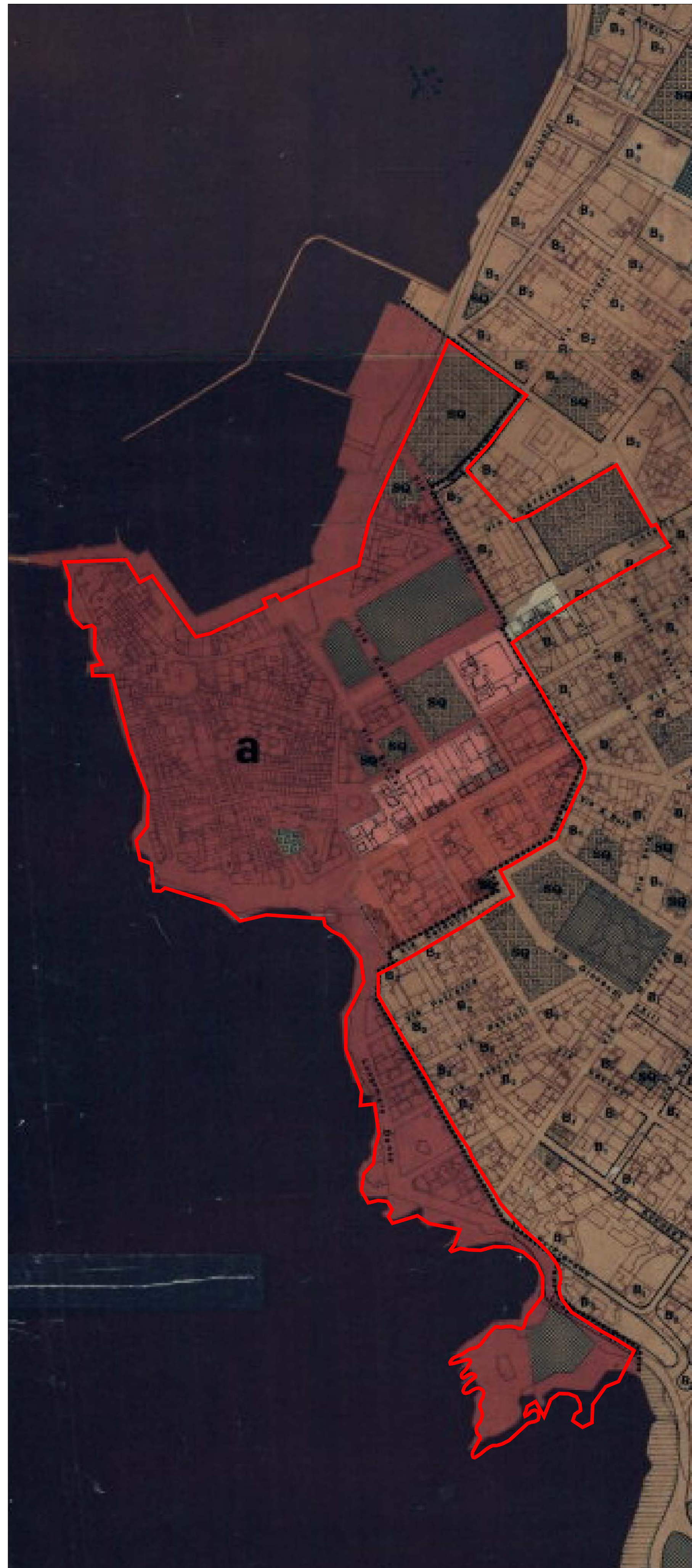
STRALCIO PIANO PARTICOLAREGGIATO DEL CENTRO STORICO scala 1:4000