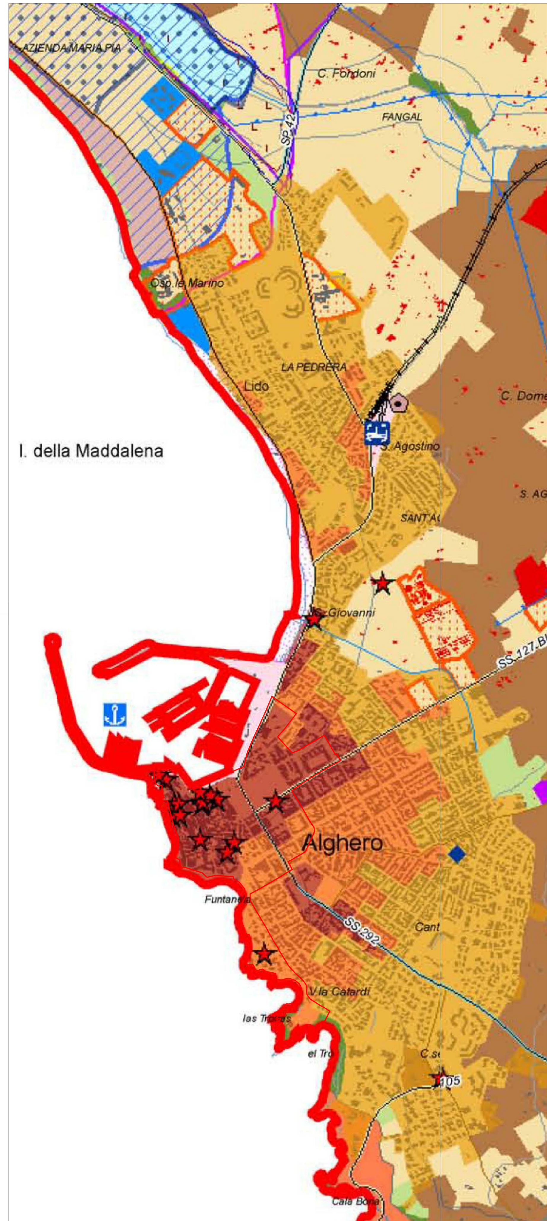
STRALCIO PIANO PARTICOLAREGGIATO ZONE B1 E B2 scala 1:10000