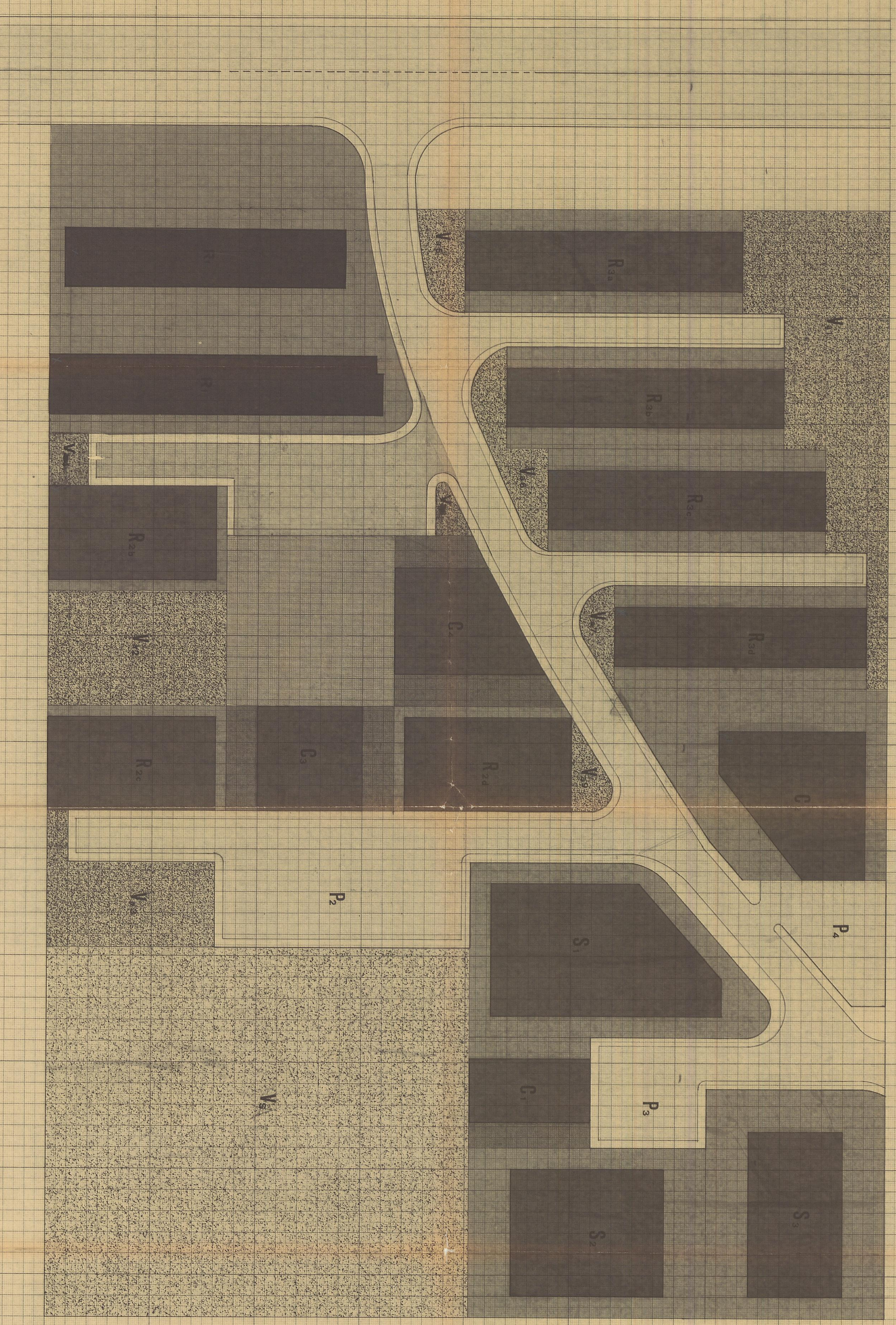
CARATTERISTICHE EDIFICATORIE E TIPOLOGICHE DEI SERVIZI