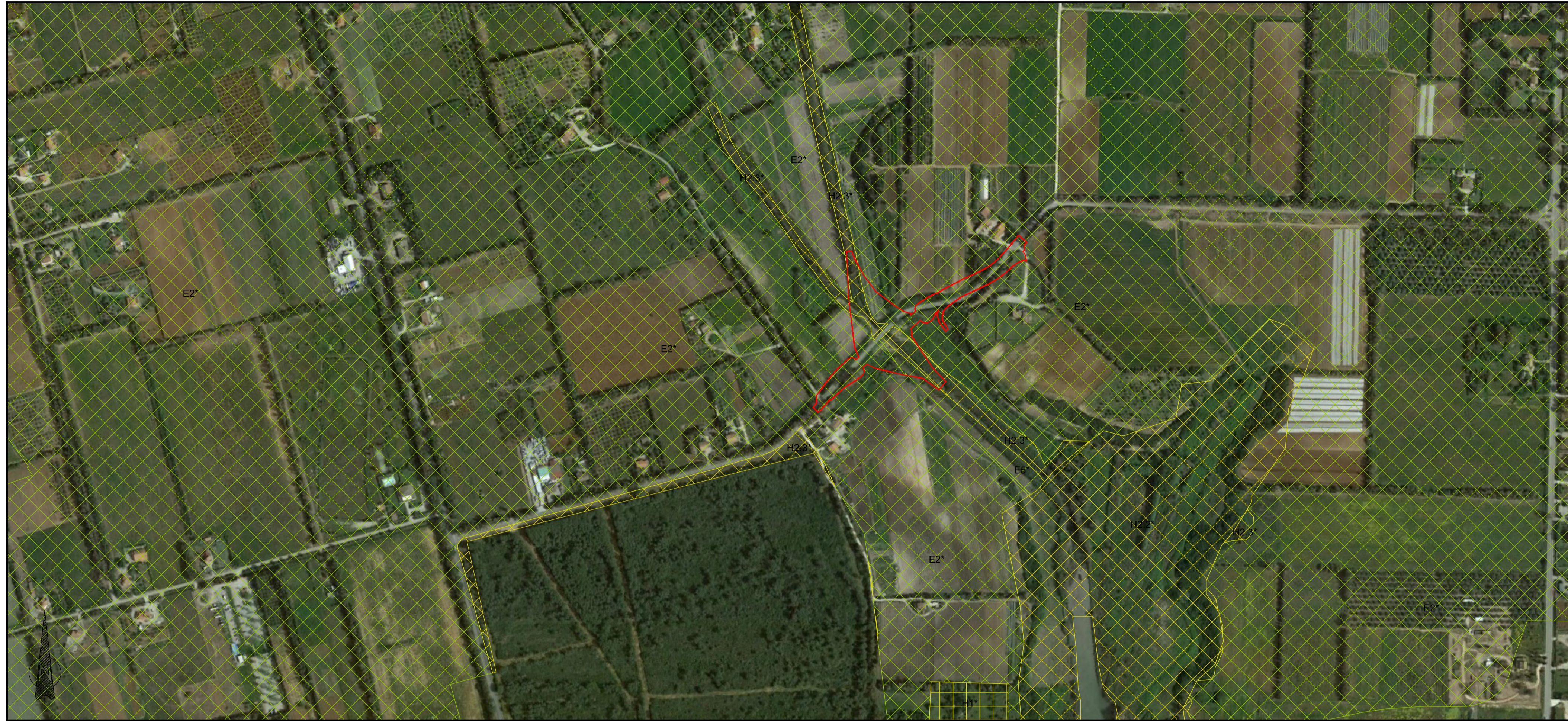
CARTOGRAFIA DI BASE: Ortofoto